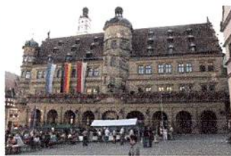
ローデンプルグ市庁舎